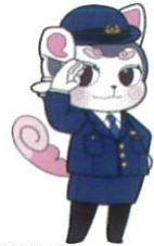
西淀川警察署オリジナルキャラクターにしこまくん こまみちゃん