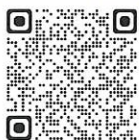
に「よん」 参考書シリーズ

こちらをご覧ください! YouTube に「よん」劇場 「人生会議編」(約15分)